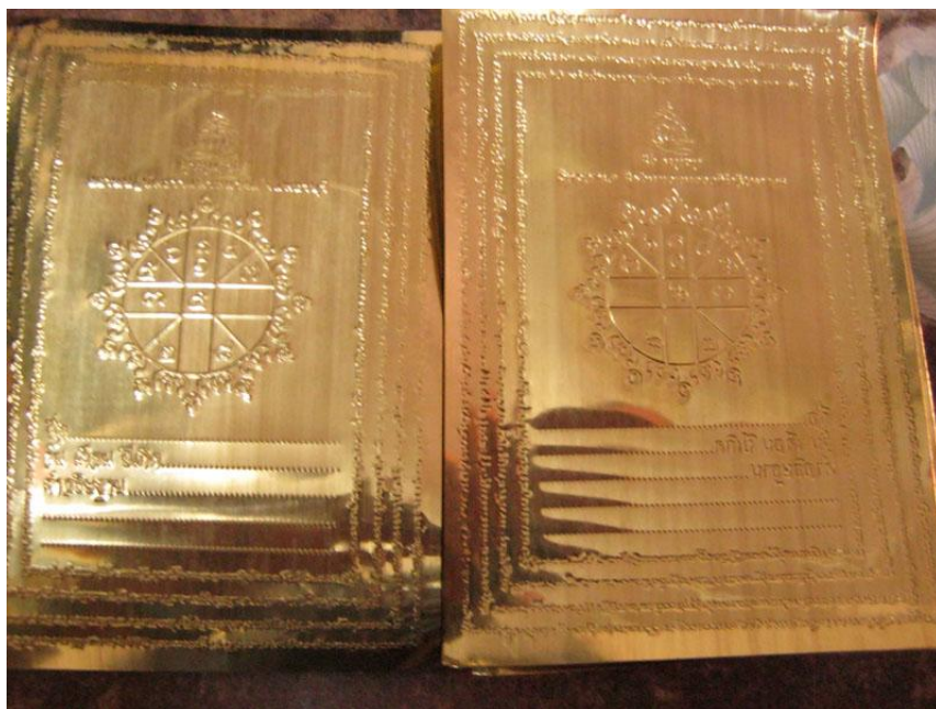
แผ่นทองดวงประสูติสมเด็จพระโต